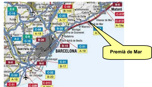
Premià de Mar

Platja Bellamar (Premià de Mar) C/Joan Prim, 12, 1-2, 08330 Premià de Mar (Barcelona) Telf.: 617-60.07.30 E-mail: wap@lamalla.net Web: www.wap-premia.com